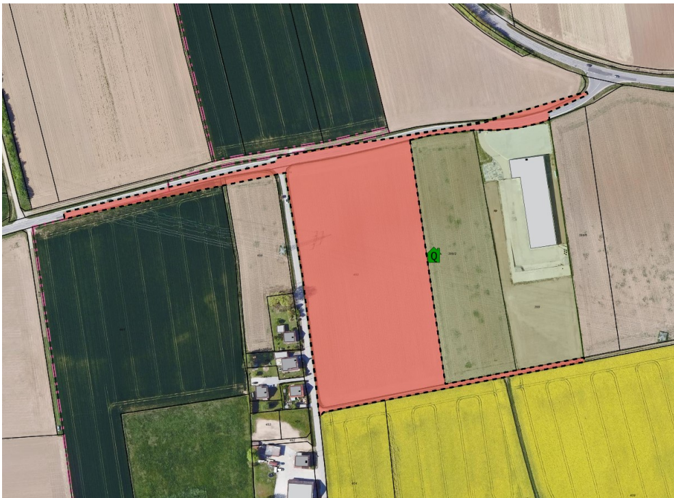
Karten eigenes GIS-Verfahren